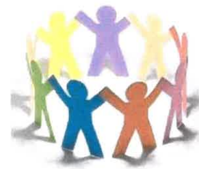
3. Ábra: Egyház és civil társadalom 6

Ahogy a sikeres és hatékony kommunikáció létrejöttéhez is két egymásrahangolt szándékú fél kell, úgy gondolom, hogy a társadalom és az egyház közötti kommunikációhoz is kell mind a két fél őszinte elhatározása, hogy újakezdi a párbeszédet egymással. Mindenkinek le kell mondania valamiről: a társadalomnak a túlzott elvárásokról és idéltlen sztereotípiákról, az egyháznak a magába zárkózó sértettségről és az áldozat-szerepről. Az új kezdethez nyitottság, őszinteség és persze bátor elszánás kell, hiszen az elején mindkét rendszer és szervezet komoly ellenállást fog majd kifejteni, már csak méretéből adódó tehetetlenségénél fogva is. A jövő útja mégis ez, mert meggyőződésem, hogy az Egyház aktív közreműködése nélkül a mai társadalom nem képes arra, hogy a maga okozta káoszból kilábaljon és valódi életcélokat találjon magának. André Malraux francia író egyik gondolatával zárnam a vizsgálódásom: A huszonegyedik század vagy vallásos lesz, vagy nem lesz egyáltalán.